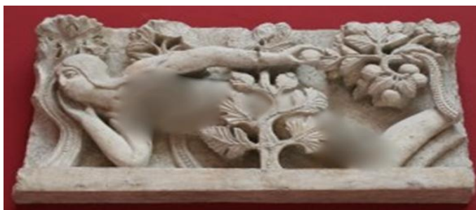
تصویر شماره ۱؛ وسوسه حوا؛ موزه رولین، فرانسه

اثرپذیری فکری هنرمندان غربی از جایگاه حوا و تأثیر عملکرد وی بر زندگی موضوعی است که در این مقاله به اجمال بررسی می‌شود. مثلاً در مجسمه‌ای با عنوان «وسوسه حوا»، اثر گیسلبرتس (Gislebertus) (۱۱۳۰ م.) (تصویر شماره ۱)، در سمت راست حوا سه انگشت دیده می‌شود که کنایه از انگشتان ابلیس است که شاخه‌ای از درخت سیب را به سمت حوا گرفته و حوا هم در حال چیدن یکی از سیب‌ها است.