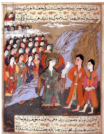
تصویر شماره ۶؛ اخراج آدم و حوا از بهشت توسط جبرئیل؛ زبده التواریخ؛ موزه هنرهای ترکی اسلامی، استانبول، ۱۵۳۸ م.