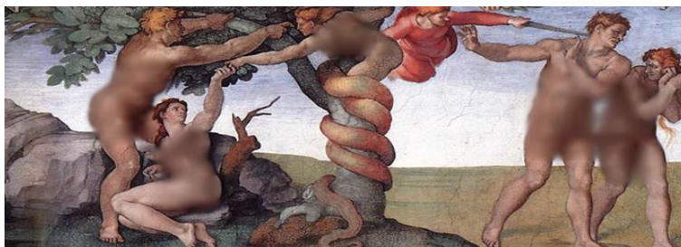
تصویر شماره ۲؛ وسوسه و هبوط آدم و حوا؛ کلیسای سیستین چپل، واتیکان

دو اثر از نقاشی‌های هنرمند بزرگ، میکل آنژ (M. Ange) (۱۴۷۵-۱۵۶۴ م.)، با نام «وسوسه و سقوط آدم و حوا» و «آفرینش حوا» این موضوع را به تصویر کشیده است. در تابلوی «وسوسه و سقوط آدم و حوا» که در سال ۱۵۱۰ م. به اتمام رسیده است (تصویر شماره ۲)، در سمت چپ، حوا دیده می‌شود که در حال گرفتن میوه ممنوعه است، در حالی که همسرش در کنارش قرار دارد و در سمت راست تصویر، آدم و حوا دیده می‌شود که در حال تبعید از بهشت‌اند.