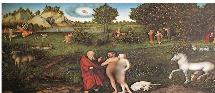
تصویر شماره ۵؛ آدم و حوا در بهشت عدن؛ موزه تاریخ هنر، وین

در تابلوی دیگر وی با نام «آدم و حوا در بهشت عدن» که در سال ۱۵۳۰ م. به تصویر کشیده شده (تصویر شماره ۵)، همه مراحل زندگی آدم و حوا از خلقت تا اخراج از بهشت بر اساس تعالیم عهد قدیم در کنار هم کشیده شده‌اند. خلقت حوا از دنده آدم در مرکز تابلو قرار دارد و در سمت راست آن، وسوسه آدم توسط حوا تصویر شده است. در قسمت چپ این اثر، آدم و حوا در حالی که در پشت بوته‌ها سعی در پنهان کردن خود دارند دیده می‌شوند و در بخش دیگر هر دو در حال اخراج از بهشت به علت نافرمانی‌شان هستند. این صحنه‌ها در حالی به تصویر کشیده شده‌اند که در قسمت پایین تابلو، آدم و حوا در حال شنیدن فرمان‌های الهی هستند.