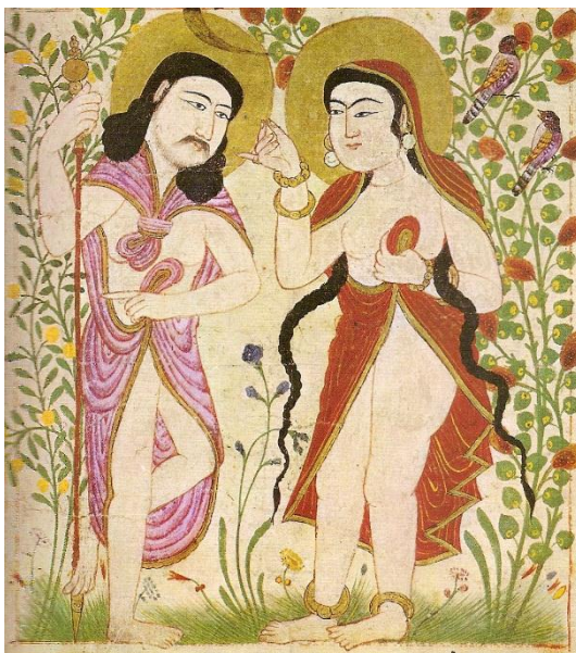
تصویر شماره ۱۰؛ آدم و حوا، لحظهٔ وسوسه؛ ابن بختیشوع (۶۹۵ ه.ق.)، ایرانی مسیحی، نگارگری مکتب تبریز اول، دوره ایلخانی

در نگارگری فوق از کتاب منافع الحيوان ، آدم و حوا پیش از نزدیک شدن به درخت ممنوعه به تصویر کشیده شده‌اند، در حالی که هر دو به یک جهت (درخت ممنوعه) اشاره می‌کنند. نقاش در اثر خود با بالاتر قرارداد دست حوا نسبت به دست آدم، حوا را با ظرافت، آغازگر وسوسه نشان داده است. حال آنکه در بسیاری از آثار برای نسبت دادن خطا به حوا از عناصر کاملاً مشهود مانند تعارف کردن سیب به آدم استفاده شده است. همچنین، هاله نور مساوی در اطراف سر هر دو شخصیت حاکی از مقبولیت تقدسی است که نقاش برای آدم و حوا قائل شده است.