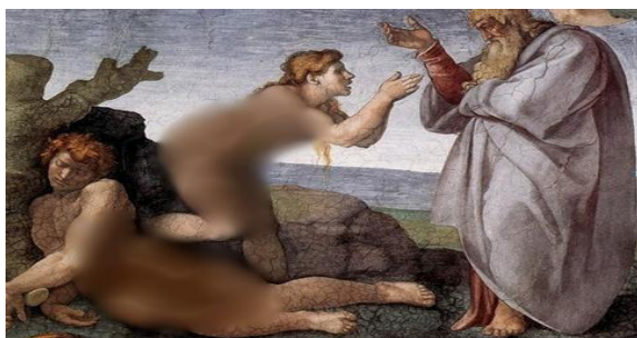
تصویر شماره ۳؛ آفرینش حوا؛ کلیسای سیستین چپل، واتیکان

در تابلوی «آفرینش حوا»، (تصویر شماره ۳)، آیات مربوط به آفرینش حوا از وجود آدم در ۱۵۰۸ تا ۱۵۱۲ م. به تصویر کشیده شده است. حوا به اراده الاهی از کالبد و دنده سمت چپ آدم، که به خواب رفته است، بیرون کشیده می‌شود.