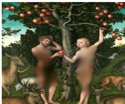
تصویر شماره ۴؛ وسوسه در بهشت عدن؛ گالری کورتالد، لندن

تابلوی نقاشی «وسوسه در بهشت عدن»، اثر لوکاس کراناخ (Lucas Cranach) (۱۴۷۲-۱۵۵۳ م.)، نقاش آلمانی است که در سال ۱۵۲۶ م. به تصویر درآورده است (تصویر شماره ۴). نقاشی حکایت از زمانی دارد که حوا با اغوای آدم و تعارف (میوه ممنوعه) به او سعی در فریفتنش دارد. ماری که به شاخه‌های بالای درخت تنیده است، کنایه از وسوسه ابلیس است که به سمت حوا کج شده است. آدم در این تابلو، در حالی که سرش را به سویی خم کرده و با یک دست در حال گرفتن سیب از حوا است، دست دیگرش را طوری بر سرش نهاده که استیصالش در مقابل همسرش هویدا است.